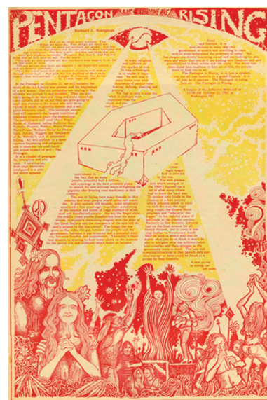
Илл. 5. Страница журнала «The San Francisco Oracle»

На страницах издания можно было встретить изображения карт Таро 20 , гностического Абраксаса 21 , портреты героев контркультуры на фоне индуистских храмов, астрологические схемы и сложные коллажи, сочетавшие все эти элементы (илл. 4). Как вспоминал Аллен Коэн: «Чтобы добиться нужного эффекта, мы, передавая художникам текст, просили их создавать макеты страниц так, чтобы это были не просто иллюстрации текста, но органичное единство слова и изображения» 22 (илл. 5).