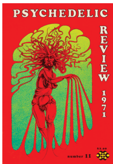
Илл. 2. Обложка журнала «Psychedelic Review»