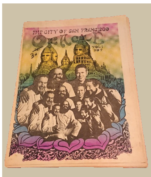
Илл. 4. Обложка журнала «The San Francisco Oracle»

называвшей себя «Психоделические рейнджеры» 19 . Кук был глубоко погружен в то, что сегодня называют западным эзотеризмом, спиритизмом и ранним ченнелингом, что отличалось от духовных поисков большинства представителей контркультуры середины 1960-х, ориентированных преимущественно на восточные традиции. Этот факт помогает понять поворот к западному эзотеризму, явственно проявившийся на страницах «Оракула Сан-Франциско» и бывший довольно революционным для 1966 года.